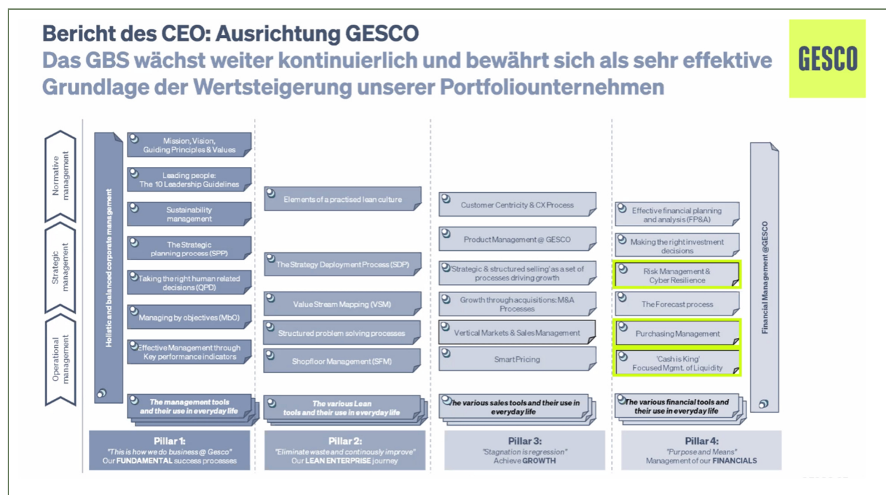
GESCO Business System; Quelle: Unternehmen

Für das laufende Geschäftsjahr rechnet das Management weiterhin mit keinem großen konjunkturellen Rückenwind. Die sich noch zu Jahresanfang abzeichnende Erholung könnte wegen der Folgen des Irankonflikts erneut vertagt werden. Für die Jahresprognose wurde daher nur ein Wachstum der deutschen